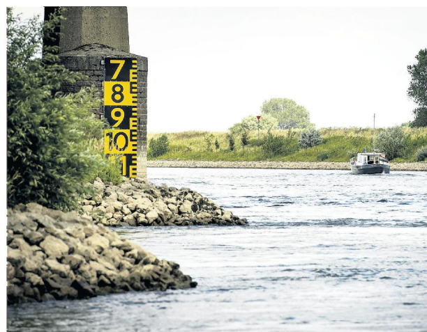
Laagwater in de IJssel vlakbij Doesburg.